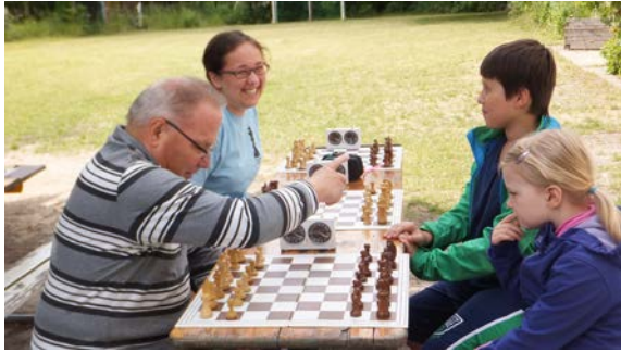
Gespannt werden die Erläuterungen verfolgt.

Auch zeigten wir den Anwesenden den Turniermodus beim Blitz- und Schnellschach. Gespannt und gebannt verfolgten sie, wie schnell teilweise die Figuren sich bewegten und vom Brett genommen wurden.